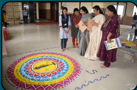
Encouraging Indian Culture -Rangoli Competition