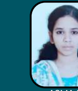
ASMA M 507/720