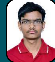
SOYIL N KHAPAREL 550/720 KRIMS, KARWAR