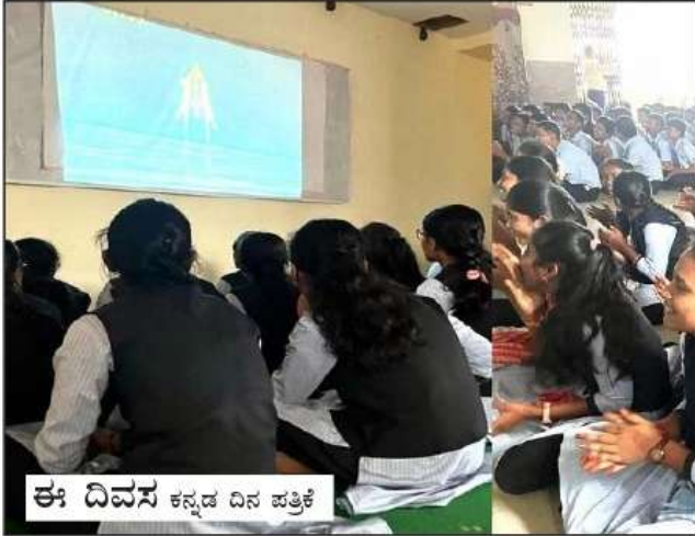
ಈ ದಿವಸ ಕನ್ನಡ ದಿನ ಪತ್ರಿಕೆ

ವಿಜಯಪುರ: ನಗರದ ಪ್ರತಿಷ್ಠಿತ ಎಕ್ಸಲೆಂಟ್ ಪದವಿ ಪೂರ್ವ ವಿಜ್ಞಾನ ಕಾಲೇಜಿನ ವಿದ್ಯಾರ್ಥಿಗಳು ಹಾಗೂ ಸಿಬ್ಬಂದಿ ವರ್ಗ ಚಂದ್ರಯಾನ-3 ಯಶಸ್ವಿ ಕಾರ್ಯಚರಣೆಯ ನೇರ ಪ್ರಸಾರ ವೀಕ್ಷಿಸಿ ಋಷಿಪಟ್ಟರು.