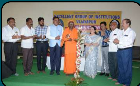
Inspiring Mentor -Teachers Day Celebration