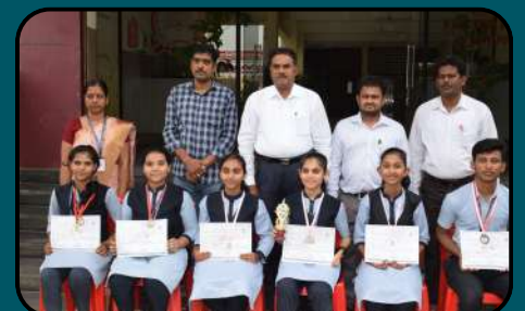
Excellent -sports Achievers

"Education is the key to unlock the golden door of freedom."