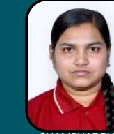
SHAMSHADBI N 535/720 SBMC, Chitradurga