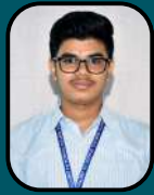
SAMARTH A 93.33%