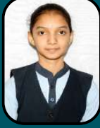
SPOORTI HALLI 96.33%