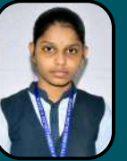
KAMALAXI M 93.83%