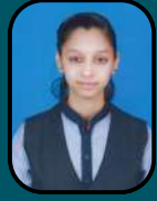
BHARTIBHOOMI R 93.33%