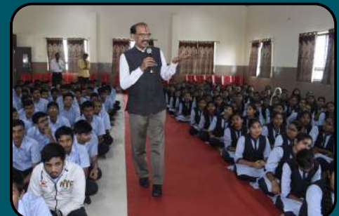
Interactive Session with ISRO Scientist