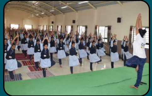
Yoga for Vasudhaiva Kutumbakam- International Yoga Day