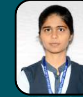
SHEET L BAGALI 535/720 CMCI, Chitradurga