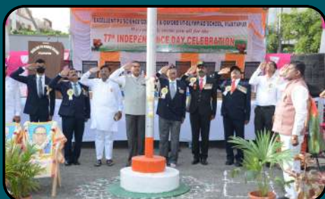
76th Independence Day Celebration