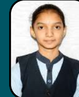
SPOORTI V HALLI 553/720 KIMS Hubli