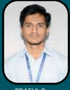
PRAFUL S 93.50%