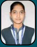
FIZA M A 93.66%