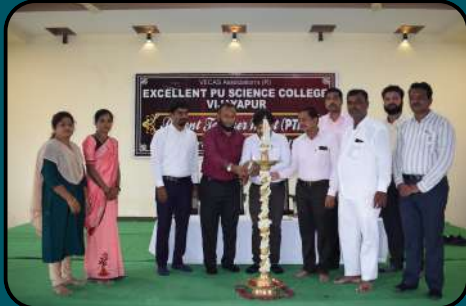
Hostellers-Parents Teacher Meeting