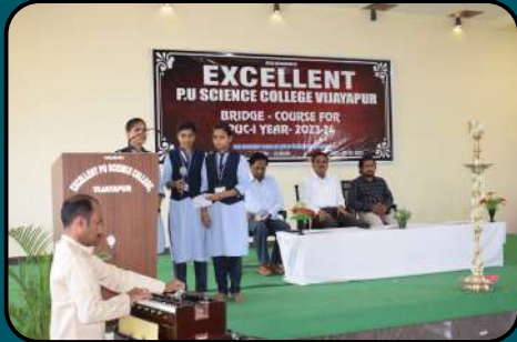
Inaugration of Bridge Course for PUC-1 Year