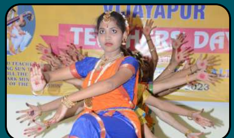
Enchanting Classical Dance by Students