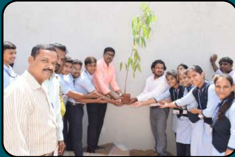
World Environment Day Celebration