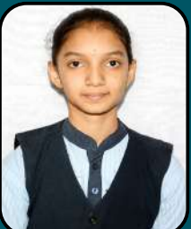
SPOORTI HALLI 92.62 %ile