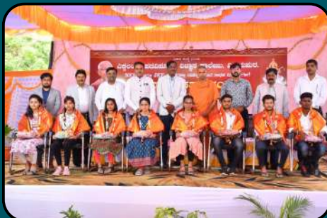
Felicitation to NEET & JEE Toppers