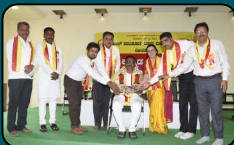
Kannada Rajyotsava Celebration