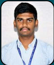
YASHASH D 97.87 %ile