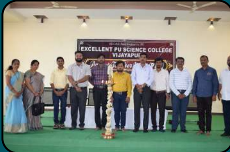
Day-scholars Parents Teacher Meeting