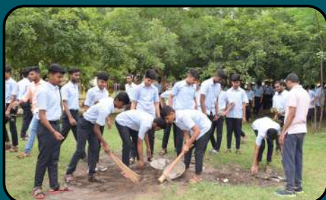
Garbage free India- Swachh Bharat Abhiyan