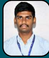
YASHASH K D 542/720 CMCI, Chitradurga