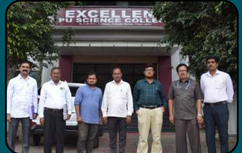
DDPU Visit for College Inspection